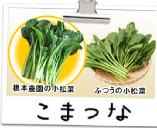
根本農園の小松菜